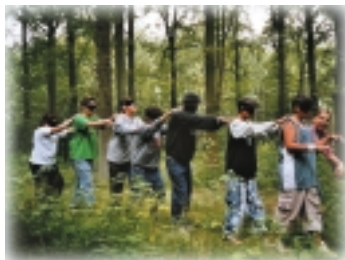
Blind durch den Wald – eine Sache des Vertrauens

Reflexionsrunden ermöglichen den Transfer des Erlebten in Alltagssituationen. Außenseiter haben Erfolgserlebnisse und erhalten die Möglichkeit, Vertrauen in sich und die Klassengemeinschaft zu erlangen. Dominanten Schülern werden ihre Grenzen aufgezeigt.