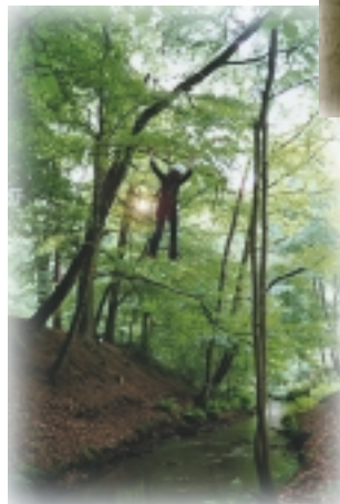
Über eine selbstgebaute Seilbrücke eine kleine Schlucht überwinden... "Jaee! Ich schaffe es!"

Outdoortraining im Rahmen von Projekttagen – ein Highlight mit Lerneffekt!