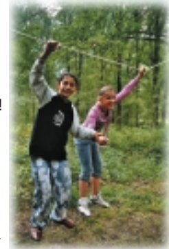
„Mohawk-Walk“ Nur gemeinsam erreichen wir das Ziel!

Ihnen gehen die Ideen aus, den Geburtstag Ihrer Tochter oder Ihres Sohnes kreativ zu gestalten? Oder wollen Sie Ihrem Kind einfach nur etwas Außergewöhnliches bieten?!