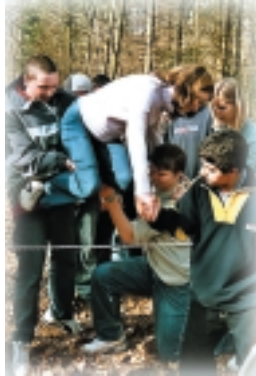
Der "Heiße Draht" darf nicht berührt werden.